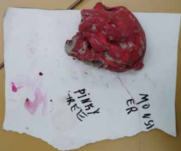
Monster Pinky Tree